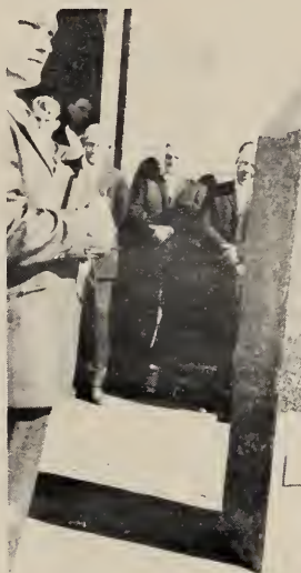
Die gedenknaald. 50 jaar.